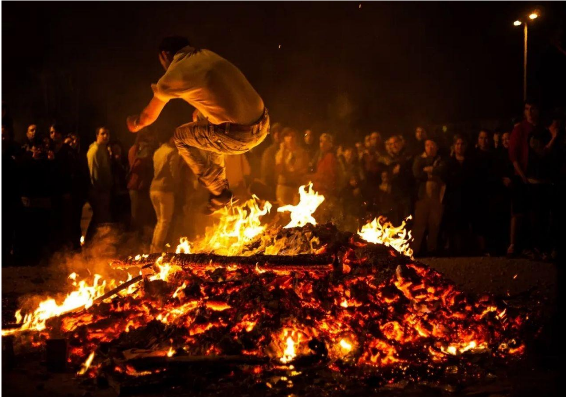
Persona saltando una hoguera durante la noche de San Juan.

En España destacan tres rituales de fuego por encima de los demás: la noche de San Juan, las Fallas y la Candelaria. La primera –a la que estamos dedicando estas líneas– es la fiesta de bienvenida del verano. Se inicia un periodo del año en el que cambiamos nuestros hábitos de vida, socializamos mucho más y estamos más tiempo al aire libre. En el caso de las Fallas, coincide en el tiempo con el equinoccio de primavera (boreal) y la quema de los ninots y lo que en ellos se representa (crítica social), simboliza la destrucción de personajes y hechos ocurridos durante el último año. Malos y buenos.