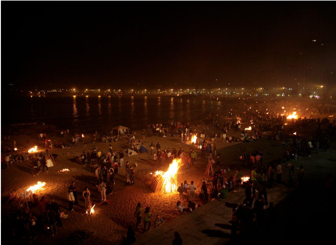
Hogueras de San Juan en la playa de Riazor, en A Coruña.

Artículo publicado originalmente en www.tiempo.com