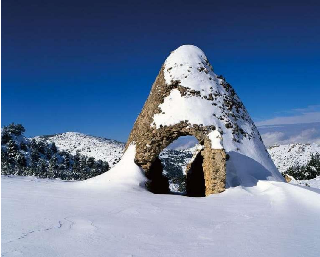
Pozo de nieve en Sierra Espuña (Murcia).

Artículo publicado originalmente como una entrada en www.tiempo.com