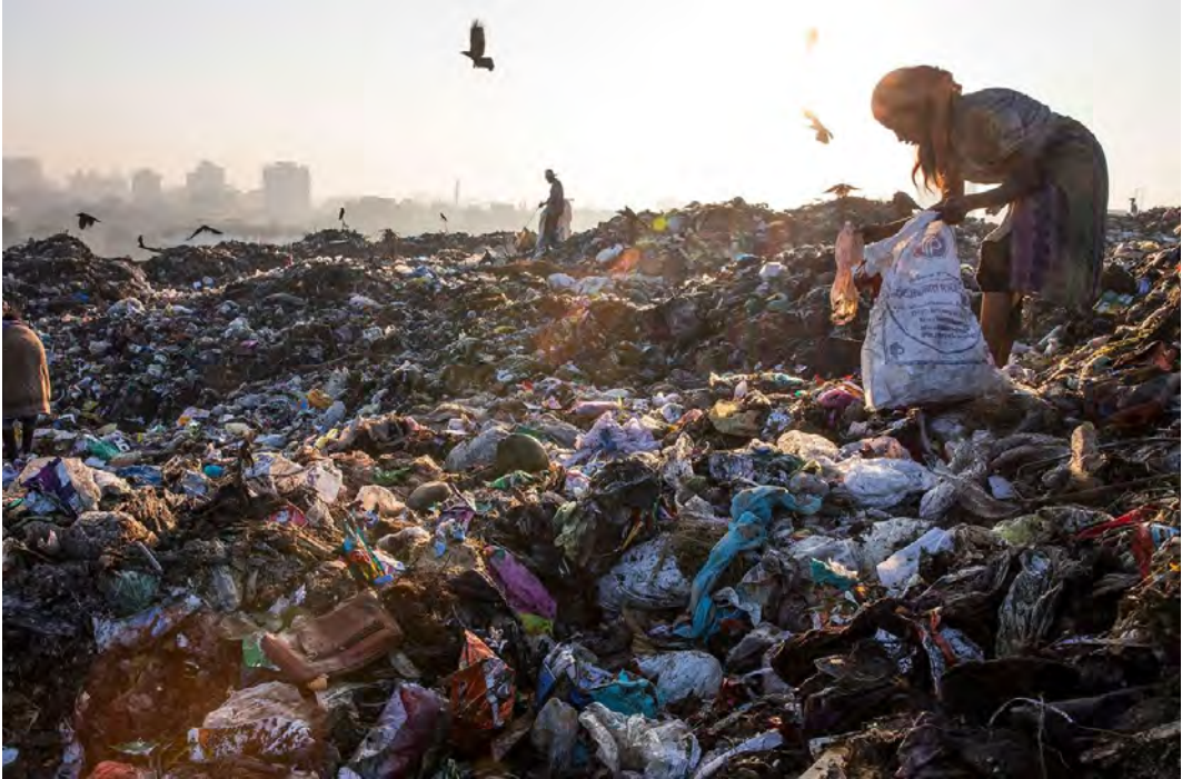
Figura 10. Vertedero de Kalyan, a las afueras de Bombay (India).