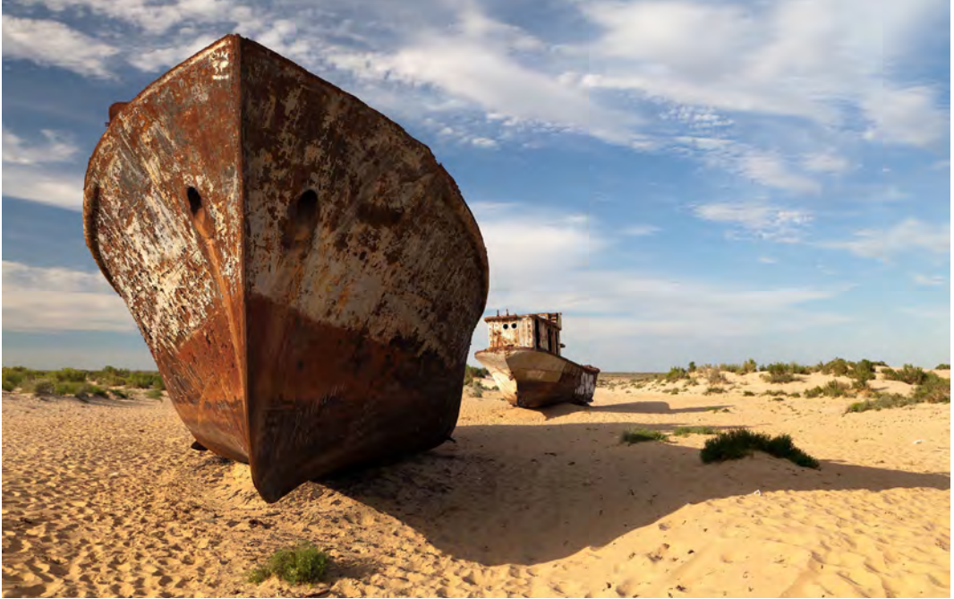
Figura 5. El desierto ocupa el mar de Aral. (Fuente: sensitur.com).

Los problemas de olores más frecuentes son causados por los carriers , productos auxiliares empleados en la tintura del poliéster, el acabado con resinas a base de formaldehído, las tinturas sulfurosas del algodón y sus mezclas, la reducción del colorante con hidrosulfito y el blanqueo con dióxido de cloro.