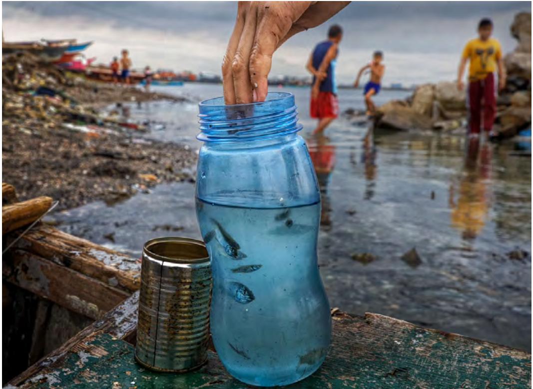
Figura 7. Ecosistemas contaminados. (Autor: Randy Olson).

La lana, a pesar de ser un producto natural y renovable, no siempre se trata de forma respetuosa con el medio ambiente, y su proceso de lavado es muy contaminante, al someterse a fuertes lavados con disolventes, algunos cancerígenos.