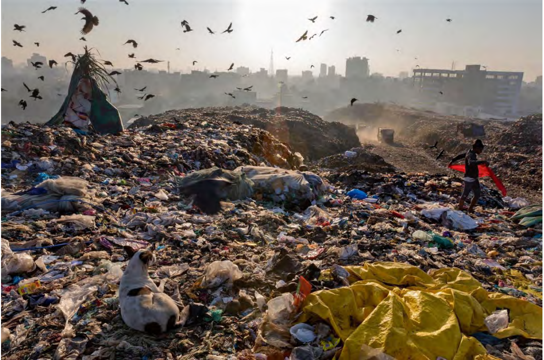
Figura 8. Recolectores de plástico en Kalyan, Bombai (India) (Autor: Randy Olson).

con propiedades únicas, pudiéndoseles llamar «tejidos inteligentes». Las nanopartículas cambian la naturaleza de los tejidos, haciéndolos más resistentes de forma que poseen una mayor capacidad de absorción con respecto a las fibras sintéticas, ya que están compuestos por gran cantidad de nanocapas que retienen la humedad con mayor facilidad. Las nanofibras, constituidas por polímeros naturales o sintéticos, presentan diferentes funciones tales como: absorción de rayos ultravioleta, propiedades antivirales, antibacteriales, antiolor, impermeables, repelentes a manchas..., asimismo las nanopartículas controlan con mayor facilidad la liberación de fragancias, biocidas (desinfectantes, conservantes, pesticidas, herbicidas) y fungicidas sobre los tejidos. Se utilizan para ropa especializada, como uniformes industriales, o de bombero, con retardantes de llama, o chalecos antibalas, de camuflaje, y camisetas que miden la presión arterial y el ritmo cardíaco.