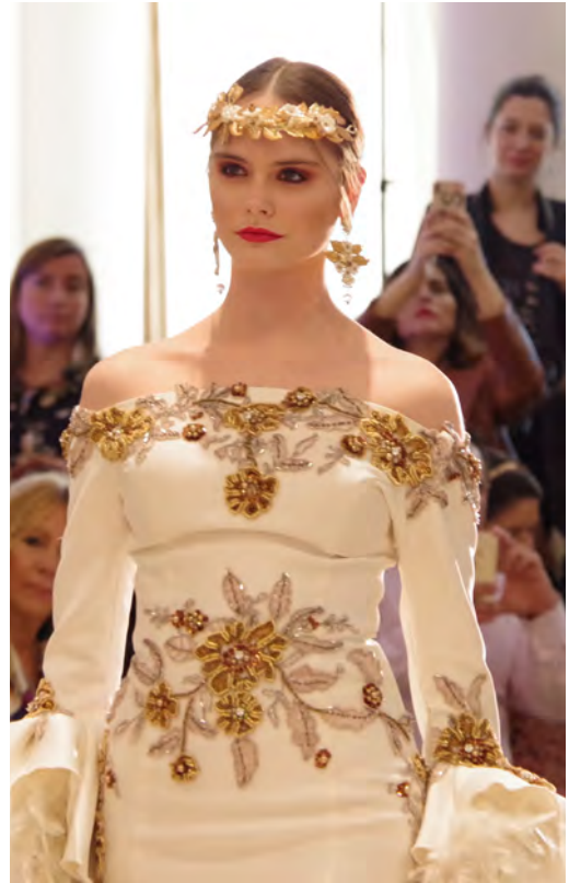
Figura 2. Pasarela de la Feria Internacional de la Moda Flamenca (FIMAF) celebrada el 23 de febrero de 2020 en Málaga. Colección de Amparo Pardal. (Autor: Julio Solís).

La industria de la moda forma parte de esa gran industria textil que incluye ropa, cuero, calzado y textiles para la casa, y lamentablemente su desarrollo se aleja mucho de la sostenibilidad ambiental, representa un 7 % del comercio global, genera un 20 % de residuos tóxicos y es una de las mayores emisoras de gases de efecto invernadero, alcanzando un 8 % del total, cifra importante cuando se habla de cambio climático, demanda ingentes cantidades de agua y energía, y emplea a más de 60 millones de personas en el mundo, gran parte de ellas mujeres y niños, frecuentemente en condiciones de explotación. Dado su tamaño, alcance global, prácticas claramente insostenibles y condiciones laborales muy precarias para los trabajadores en las zonas de producción, su impacto en los indicadores de desarrollo social y ambiental es muy importante. Esta situación ha alcanzado en los últimos años su punto culminante en la llamada fast fashion o moda rápida, que lleva a un hiperconsumo, y a las marcas de moda a superproducir más cantidad de producto en menos tiempo. Esto supone que solo el 1 % aproximadamente de los productos que se compran se siga usando después de 6 meses, quedando el 99 % restante desechado al cabo de ese plazo, es la obsolescencia programada aplicada a la moda (figura 3).