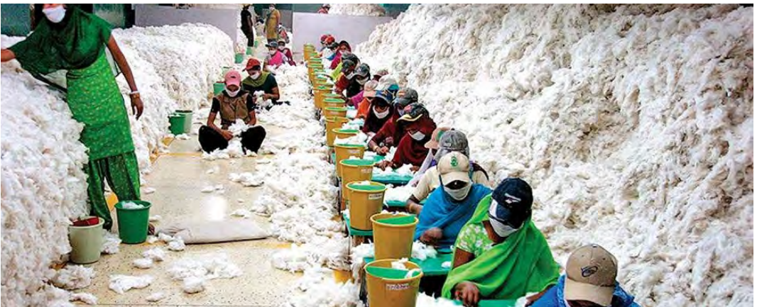
Figura 4. Hilandería india. (Fuente: www.dnaindia.com ).

El estudio de la huella de carbono en el sector textil es uno de los elementos fundamentales para controlar el impacto en el medio ambiente. Por ello, a las emisiones directas de CO 2 de los combustibles fósiles que se queman, incluido el consumo de energía doméstica y el transporte utilizado, se han de sumar las emisiones indirectas durante todo el ciclo de vida de los productos utilizados. A nivel mundial se consumen una media de 11,4 kilos de ropa al año (en España una media de 7 kg), lo que genera 442 kg de CO 2 emitido per cápita, lo que supone, como ya se ha dicho, el equivalente al 8 % del total. A estos efectos hay que añadir los de la deslocalización, que provoca que los grandes centros de producción se sitúen en países con una laxa o nula legislación ambiental.