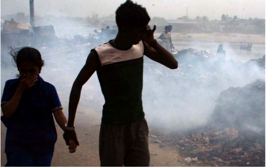
Figura 6. La incineración de basura contribuye gravemente a la contaminación del aire y al calentamiento global. (Fuente: UNICEF/Khan, http://news.un.org/ ).