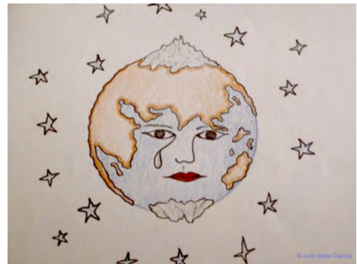
Figura 1. La Tierra triste. (Autor: Julio Solís).

Siempre que se habla de cambio climático, de políticas ambientales, de procesos económicos sostenibles y más o menos respetuosos con el medio ambiente, se piensa en los gases de efecto invernadero, la contaminación de los mares, los ríos y la atmósfera, la disminución de los hielos polares, y el gravísimo envenenamiento del planeta en su conjunto, pero no es tan frecuente asociar algo tan necesario y cotidiano como la vestimenta, y las industrias relacionadas con los tejidos (industria textil, moda, diseño, nuevos materiales, nanotecnología, ...), con el cambio climático y con la sostenibilidad desde el punto de vista ambiental (figura 1).