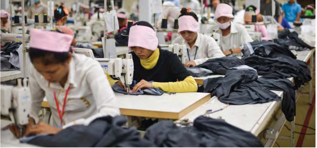
Figura 3. Fábrica de costura en Phnom Penh (Camboya)..